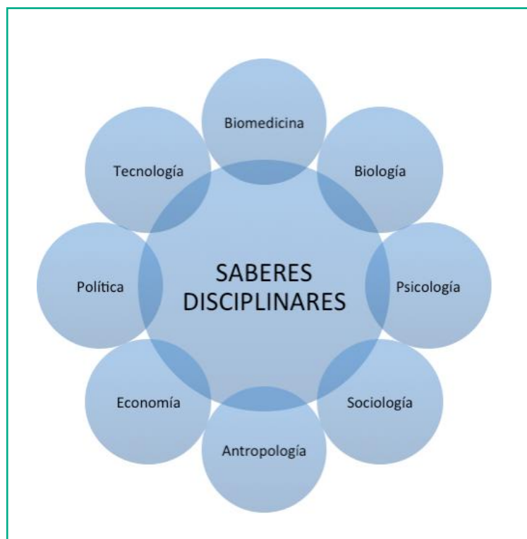
Figura 3. Saberes disciplinares involucrados en la relación comunicación - diversidad

En el sentido inverso, el reconocimiento y valoración de la diversidad provee un escenario de pluralidad propicios para el trabajo inter y transdisciplinar, desde un enfoque innovador donde se combinan los desarrollos ingenieriles, de diseño, de arte y de arquitectura, con el talento humano en salud y con los saberes de las ciencias humanas para generar desarrollos científicos, técnicos y tecnológicos, que contribuyan a la consecución de una mejor calidad de vida de los individuos comunicativamente diversos. La figura 2. Muestra la representación gráfica de las dos aristas de la relación comunicación y diversidad personal.