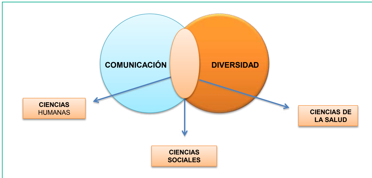
Figura 1. Campos de conocimiento involucrados en la relación comunicación y diversidad

La palabra diversidad puede analizarse tanto por su origen griego como por el latino. En esa medida se dice que diversidad proviene